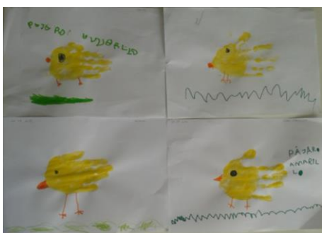
Figura 4 – Carimbo com mãos