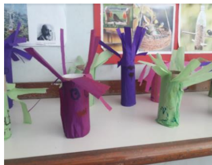
Figura 3 – Material reciclável