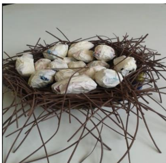
Figura 2 – Ovos de papel