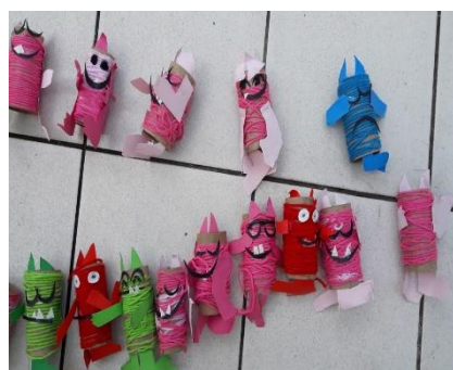
Figura 5 – Monstro com a cor da emoção