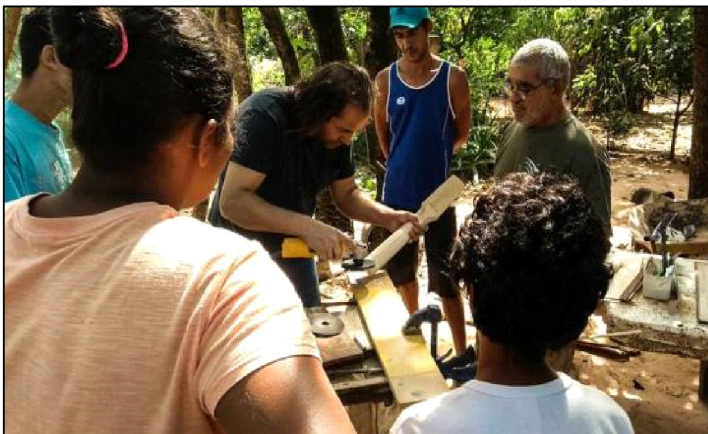
Figura 4 - Construção do braço da viola caipira

A Figura 4 apresenta o momento de construção do braço da viola caipira. Essa etapa exigiu atenção técnica, precisão no manuseio das ferramentas e colaboração entre os participantes.