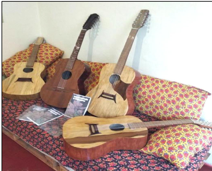
Figura 5 - Violas caipiras finalizadas