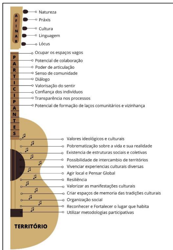
Figura 6 - Desenho da viola com recomendações para o (re)envolvimento rural