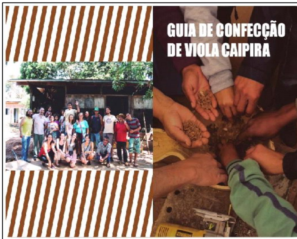
Figura 1 - Guia de confecção de viola caipira realizado durante o projeto de extensão