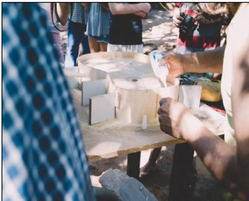
Figura 3 - Trabalhando na construção do bojo da viola

O primeiro dia de trabalho concentrou etapas fundamentais da confecção dos instrumentos. Foram realizados cortes de partes básicas da viola, como fundo, tampo e laterais, além da elaboração dos leques harmônicos e da colagem das peças que formariam o bojo do instrumento. A Figura 3 registra esse momento de trabalho coletivo na construção do corpo da viola.