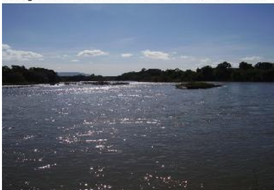
Figura 9: Rio Paranã e seu leito caudaloso. Local da confluência entre Rio Paranã e Ribeirão dos Bois deságua. A autoria: Luana N. M. de Lima, maio 2011.