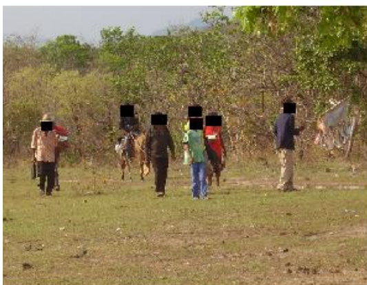
Figura 4: Foliões fazendo o giro da folia. Autoria: Luana Nunes M. de Lima – 11/10/2011.