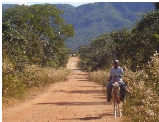
Figura 2: Morador pelas trilhas da região. Autoria: Luana N. M. de Lima, maio 2011.