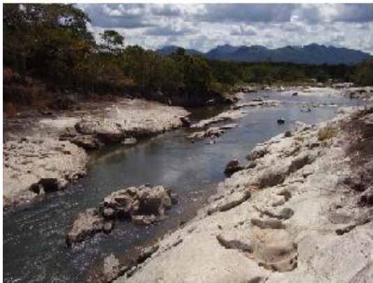
Figura 6: Ribeirão dos Bois, próximo a ponte. A autoria: Luana N. M. de Lima, maio 2011.