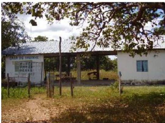
Figura 12: Casa de farinha em Diadema. Autoria: Luana N. M. de Lima, maio 2011.