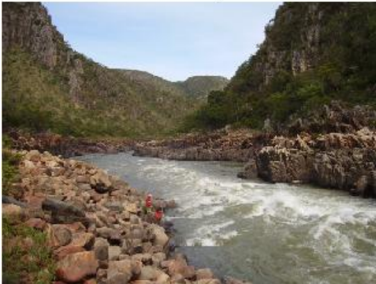
Figura 10: Funil; pescadores das comunidades. Autoria: Luana N. M. de Lima, maio 2011.