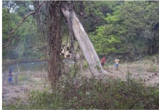
Figura 14: Moradores trabalhando em roça nas margens do Ribeirão dos Bois. Autoria: Luana N. M. de Lima, maio 2011.

Ao serem questionados sobre as possibilidades de desenvolvimento turístico na região, os moradores demonstram interesse e o vêem como algo necessário. Além disso, afirmam que a região possui potencialidades pouco exploradas e acreditam que essas potencialidades poderiam ser utilizadas pelas próprias comunidades para geração de renda e melhoria da qualidade de vida. Entretanto, suas perspectivas com relação ao turismo são mínimas, tendo em vista o desconhecimento, a falta de capacitação, de recursos econômicos e de políticas específicas para desenvolvê-lo. A fala de uma moradora da comunidade Diadema expressa a opinião de muitos outros moradores da região sobre o turismo: