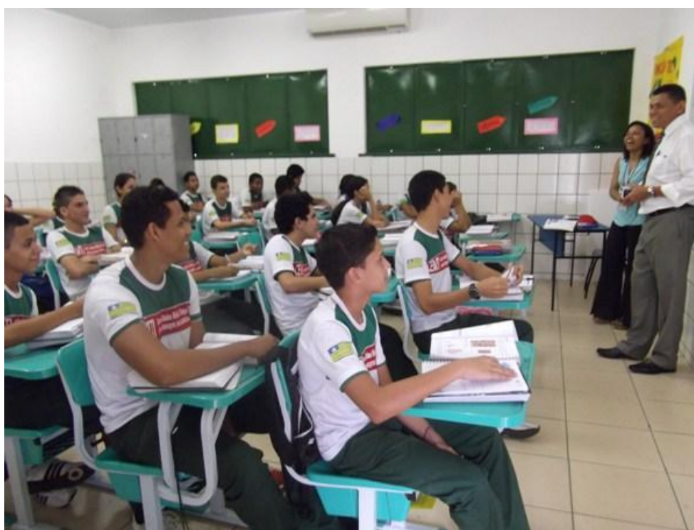
Figura 4 - Escola pública em Teresina-Piauí

Atualmente temos um panorama social que, apesar das melhorias de acesso aos serviços básicos, é objeto de questionamentos em se falando de investimentos para com os menos favorecidos, como, por exemplo, saúde e educação de qualidade e facilidade no acesso aos serviços públicos. As classes menos favorecidas reivindicam através de solicitações junto aos gestores públicos melhorias de suas condições de vida, e de seu bem-estar humano do aumento do número de escolas do acesso aos serviços básicos, ou seja. Apesar dos avanços ainda há muito o que se fazer para a melhoria do cenário educacional.