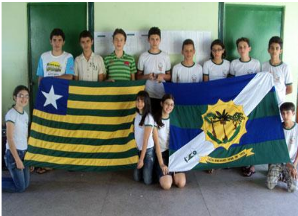
Figura 3 - Alunos de escola pública representando o Piauí em competições nacionais

população do território piauiense, e a educação, através de alguns exemplos, como o município de Cocal dos Alves que teve um considerável número de aprovações nas olimpíadas de matemática e no ENEM (Exame Nacional do Ensino Médio) pode representar muito bem isso.