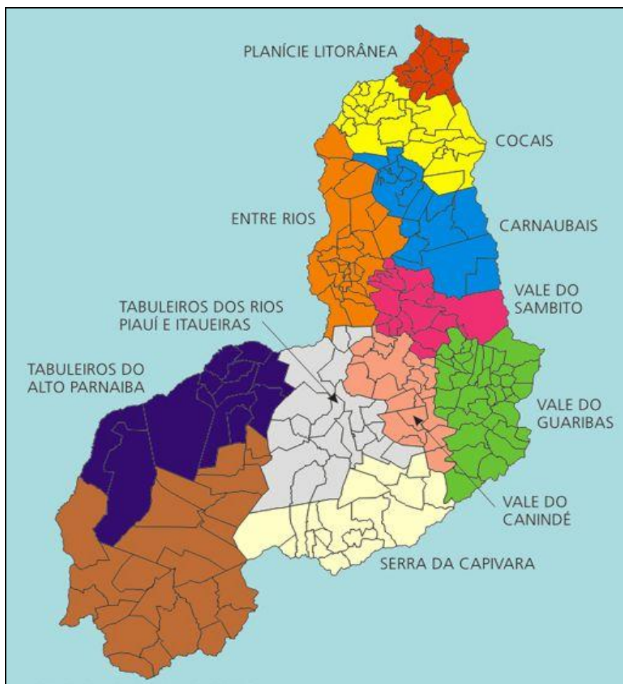
Figura 2 – Mapa dos territórios de desenvolvimento do Piauí 8

O contínuo desgaste das condições de vida na zona rural serviu como fator de atração da população piauiense para outros estados e algumas das principais cidades do Piauí, refletindo diretamente no crescimento urbano, principalmente de Teresina, Parnaíba, Picos, Campo Maior e Piri-piri. Os maiores avanços em infraestrutura aproximaram ainda mais as cidades interioranas a capital Teresina. O considerável crescimento das principais cidades do território piauiense teve como reflexo as perspectivas para um cenário educacional e isto ficou evidenciado com a redução do analfabetismo e o crescimento da oferta de vagas no ensino superior.