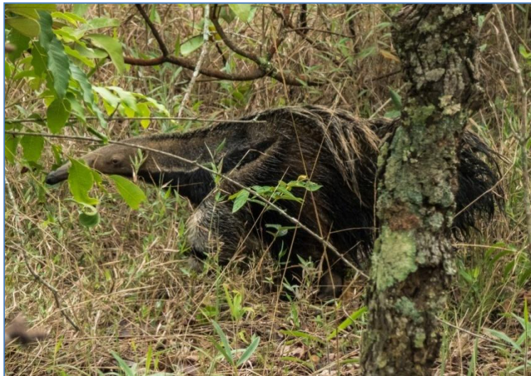
Foto 1. Tamanduá-bandeira Myrmecophaga tridactyla Linnaeus, 1758 registrado em 16/11/2015 (16°23'39,8"S 048°56'16,5"W).

No dia 22 de fevereiro de 2016, por volta das 06:50h da manhã, um exemplar adulto de lobo-guará Chrysocyon brachyurus (Illiger, 1815) foi visto e fotografado em uma área de pastagem abandonada (16°23'05,6"S 048°56'23,6"W) adjacente à mata de galeria do Córrego Barreiro, que atravessa parte da reserva da UEG (Foto 2). A área é ocupada por gramíneas do gênero Brachiaria . A visualização durou aproximadamente 2min. Durante o registro o indivíduo foi visto dando um salto no ar em direção ao solo, comportamento considerado como estratégia de caça (RODDEN; RODRIGUES; BESTELMEYER, 2004). Ao notar a presença de observador, correu em direção à mata de galeria. O dia também estava nublado.