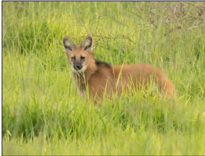
Foto 2: Lobo-guará Chrysocyon brachyurus (Illiger, 1815) registrado em 22/02/2016 (16°23'05,6"S 048°56'23,6"W).