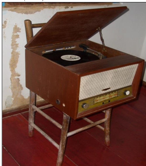
Figura 4 – Radiola movida a corda