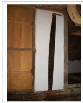
Figura 6 – Serra manual Fazenda D. N.