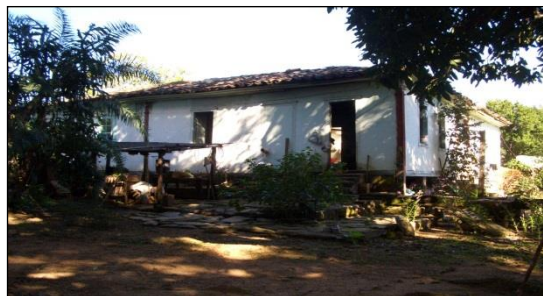
Figura 2 - Casa com arquitetura colonial existe na Bacia – Dona E