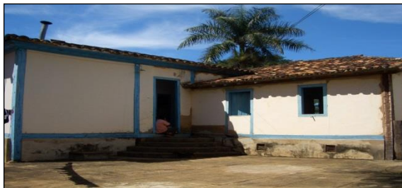
Figura 1 Casa com arquitetura colonial existe na Bacia