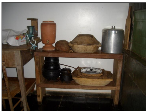
Figura 8 – Organização de elementos da cultura material na cozinha