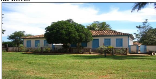
Figura 3 – Casa com arquitetura colonial existe na Bacia