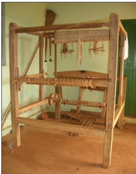
Figura 7 – Tear para fabricar tecido

A realização de um diagnóstico qualitativo, auxilia na interpretação dos processos de enraizamento da cultura num dado local. O Cerrado, a roça, o curral, as panelas, o fogão a lenha, o serra, são elementos constituidores do modo como é possível explicar, as re-existências de vários sujeitos que buscam na vida simples do campo, reafirmar suas identidades e construir novas possibilidades através de um “modo de vida” que perde espaço, para a vida moderna e globalizada, a cada dia.