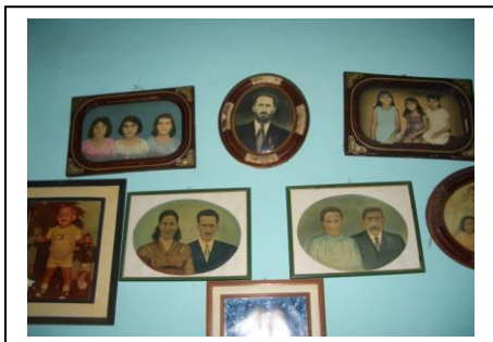
Figura 5 – Retratos dos familiares Fazenda D. N. –