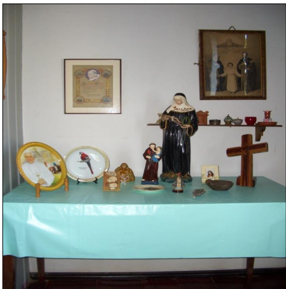
Figura 3 – Altar : propriedade de Dona N.

Trata-se de objetos que servem como instrumento de trabalho, no dia-a-dia, bem como, dão identidade aos sujeitos que os utilizam em seu cotidiano. Adiante alguns desses objetos são apresentados por intermédio das figuras 4, 5, 6, 7, 8 e 9.