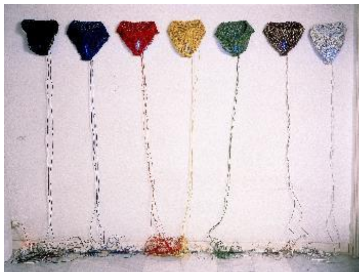
Figura 7. "7 palabras acerca de la sexualidad". Instalación. Obra de Maribel Doménech expuesta en Museari .

Atento y paciente, un joven mira hacia el futuro. El arte permite una mirada más abierta y significativa de nuestros propios procesos de conocimiento. La curiosidad es un camino lleno de sorpresas. Las prohibiciones forman parte del lenguaje del poder.