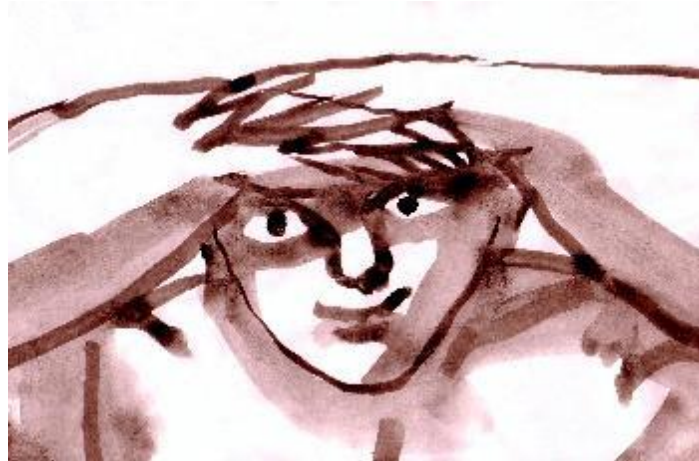
Figura 6. "Observador". Pintura. Obra de José Manuel Guillén expuesta en Museari .

Atento y paciente, un joven mira hacia el futuro. El arte permite una mirada más abierta y significativa de nuestros propios procesos de conocimiento. La curiosidad es un camino lleno de sorpresas. Las prohibiciones forman parte del lenguaje del poder.