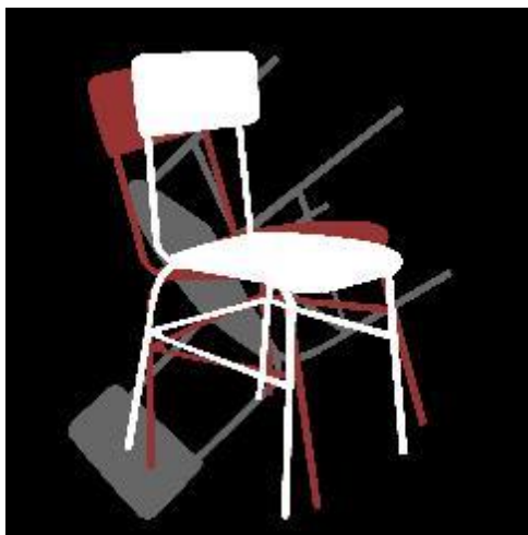
Figura 2. “No hay futuro”. Diseño. Obra de Álex Meza expuesta en Museari .

Aquí el artista nos sitúa en un Álbum de fotos de boda peculiar, ya que los que se casan son dos hombres, y en la imagen es el hijo de uno de ellos quien abraza a su padre. La peculiaridad de las imágenes es que se transmiten los sentimientos, con abrazos y gestos de cariño. No hay poses, la gente que asistió a la boda no sabía que se estaban haciendo las fotografías para un reportaje.