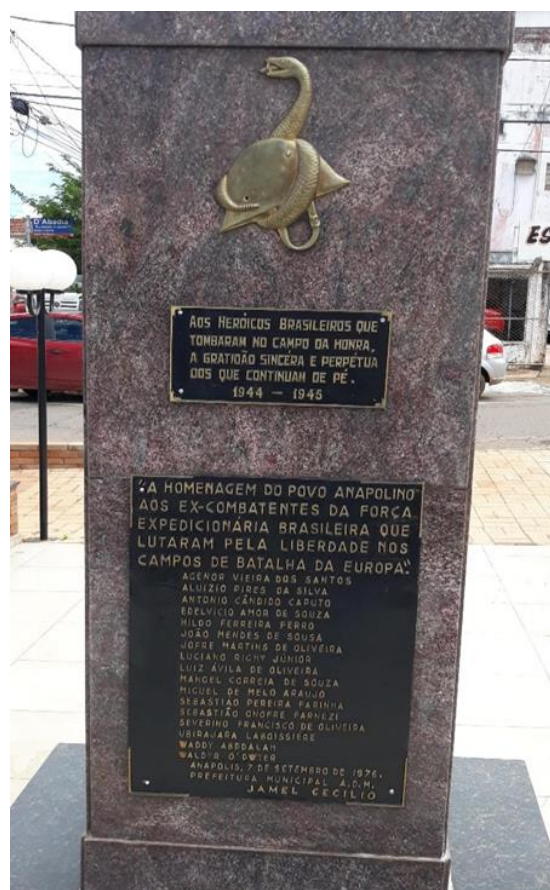
Fig. 3 - O monumento dos pracinhas – Anápolis GO. À esquerda o monumento visto de frente; à direita o monumento visto de costa.