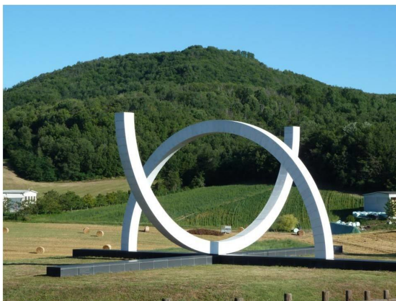
Fig. 2 - Monumento ai Caduti Brasiliani, inaugurado no ano de 2001, na proximidade do Monte Castelo, na Itália.

Monumentos desse tipo se espalharam por várias cidades do país e existe um deles até na Itália, palco da ação militar dos soldados brasileiros. Trata-se do Monumento ai Caduti Brasiliani, inaugurado no ano de 2001, na proximidade do Monte Castelo, cuja configuração é representada por dois arcos brancos, sendo que um dos arcos que aponta para o chão simboliza a morte e o que aponta para o céu simboliza a transcendência heroica do sacrifício dos soldados.