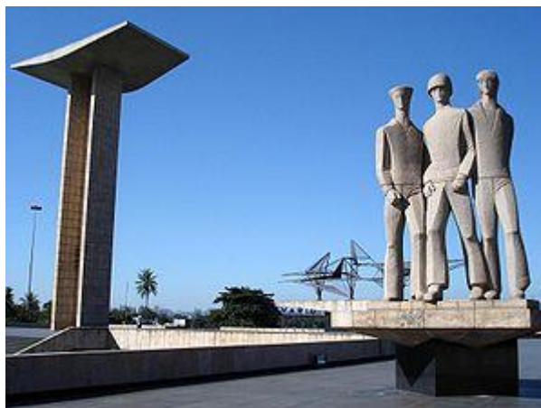
Fig. 1 - Monumento Nacional aos Mortos da Segunda Guerra Mundial, localizado no parque Eduardo Gomes, na cidade do Rio de Janeiro, no Brasil.

Monumentos desse tipo se espalharam por várias cidades do país e existe um deles até na Itália, palco da ação militar dos soldados brasileiros. Trata-se do Monumento ai Caduti Brasiliani, inaugurado no ano de 2001, na proximidade do Monte Castelo, cuja configuração é representada por dois arcos brancos, sendo que um dos arcos que aponta para o chão simboliza a morte e o que aponta para o céu simboliza a transcendência heroica do sacrifício dos soldados.