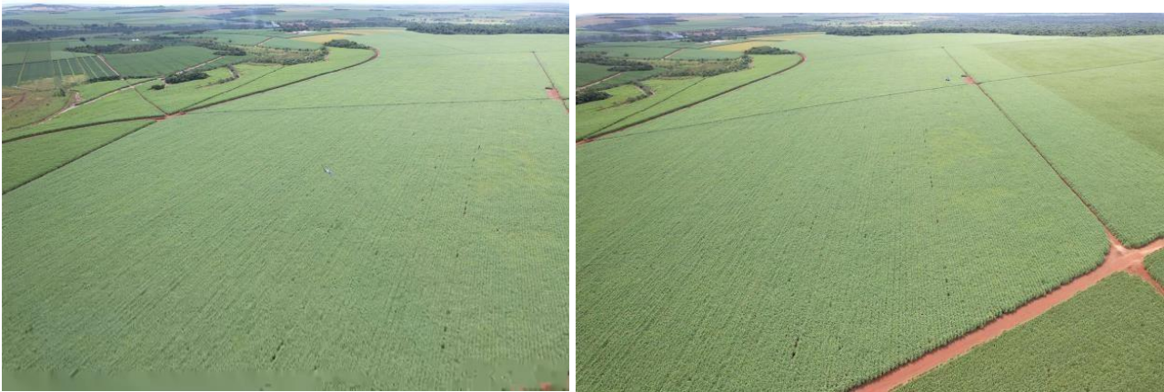
Figura 1e 2 – Vista aérea da plantação de cana-de-açúcar na região de estudo.

As imagens de satélite capturam ainda mais profundamente o contraste entre o Cerrado remanescente e os campos de cultivo, marcando a supressão de matas ciliares, a canalização de cursos d'água e a substituição das cores e formas naturais por geometrias agrícolas. Como afirmam Tavares e Viana (2021), as imagens de satélite se tornam testemunhas da destruição, permitindo ver o que a narrativa oficial tenta omitir.