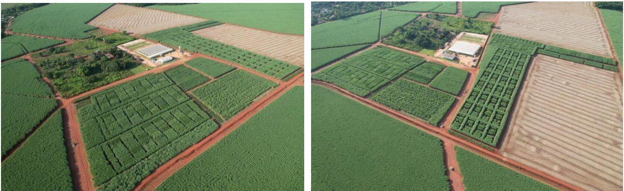
Figura 3 e 4 – As imagens evidenciam o desaparecimento de veredas e a atividade a todo vapor da indústria sucroalcooleira.

As imagens de satélite capturam ainda mais profundamente o contraste entre o Cerrado remanescente e os campos de cultivo, marcando a supressão de matas ciliares, a canalização de cursos d'água e a substituição das cores e formas naturais por geometrias agrícolas. Como afirmam Tavares e Viana (2021), as imagens de satélite se tornam testemunhas da destruição, permitindo ver o que a narrativa oficial tenta omitir.