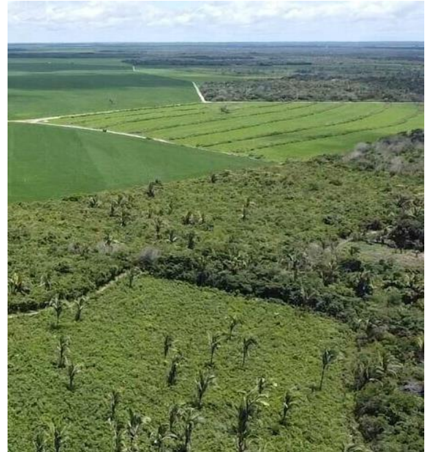
Figuras 8 e 9 – Fragmentos de Cerrado preservado ao lado de campo de cana. Contraste entre biodiversidade e monocultura.

O papel do pesquisador, nesse contexto, se amplia: não se trata apenas de registrar imagens, mas de saber ler e narrar por meio delas. Como sugere Rancière (2005), o poder político da imagem reside na sua capacidade de redistribuir a sensível — ou seja, de tornar visível o que antes era ignorado ou invisibilizado. As imagens do Cerrado em chamas, da terra nua, da monocultura estendida até o horizonte não são apenas registros, mas também convites à reflexão e à ação.