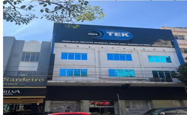
Figura 6 – Avenida Goiás, nº 364(2025)