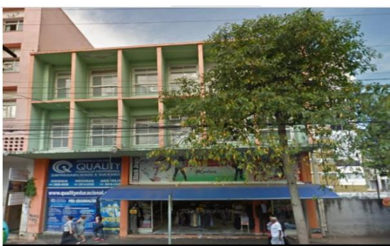
Figura 3 – Avenida Goiás, nº 346 (2011)

Das 49 edificações identificadas na Avenida Goiás, entre a Praça Cívica e a Avenida Paranaíba, apenas cinco fachadas foram restauradas, em 2008, pelo Grupo Quatro S/C Ltda. e pela empresa Biapó, sob supervisão do IPHAN. Não bastasse essa reduzida implementação à época do projeto, evidencia-se, 17 anos depois, que letreiros comerciais ou pichações voltaram a encobrir algumas dessas construções, conforme se verifica no prédio do O Popular, localizado no nº 345, avenida Goiás (figura 8). Nos endereços nº 346 e 364, Avenida Goiás (figuras 3 e 5), nota-se que fachadas foram totalmente encobertas por concreto, destruindo a arquitetura Déco das edificações históricas: