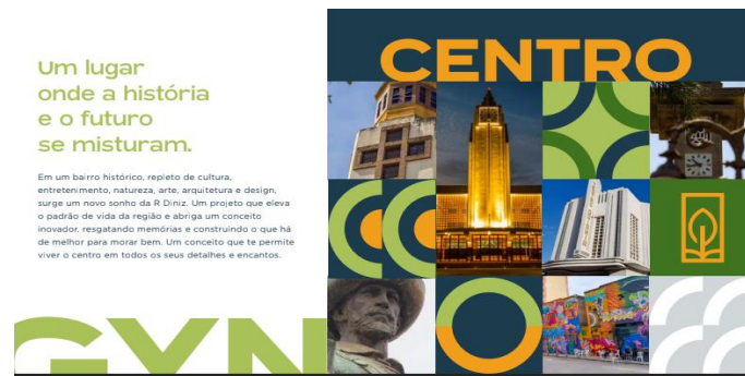
Figura 9 – Empreendimento Central Park

RDINIZ INCORPORADORA. Central Park Residencial [book digital]. Goiânia, 2024.