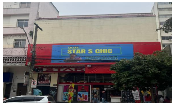
Figura 4 – Avenida Goiás, nº 346 (2025)