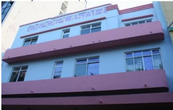
Figura 7 – Avenida Goiás, nº 345 (2008)