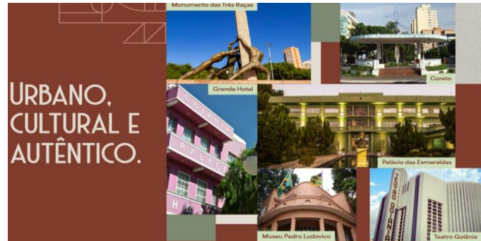
Figura 11 – Ludovic Apartaments

TAPAJÓS ENGENHARIA. Ludovic Apartments [material publicitário digital]. Goiânia, 2024.