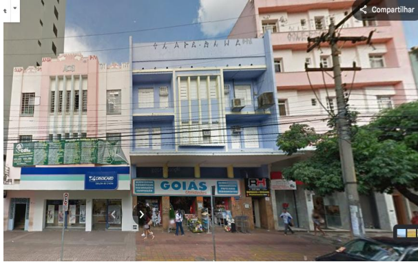
Figura 5 – Avenida Goiás, nº 364 (2011)