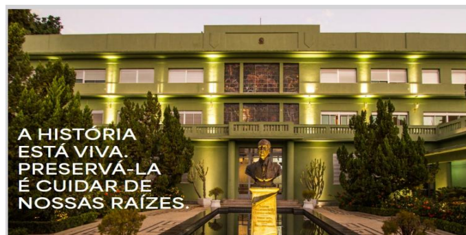
Figura 10 – Empreendimento Ludovic Apartments

TAPAJÓS ENGENHARIA. Ludovic Apartments [material publicitário digital]. Goiânia, 2024.