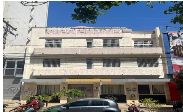
Figura 8 – Avenida Goiás, nº 345 (2025)