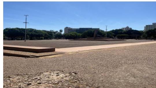
Figura 2 – Praça Cívica após a intervenção