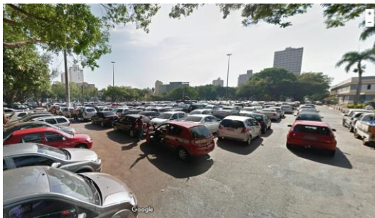
Figura 1 – Praça Cívica antes da intervenção

abrir espaço e limpar a visão, ressaltando a arquitetura Art Déco do Teatro Goiânia, além de estruturar subterraneamente o local para receber eventos menores. Não abarcou, porém, as necessidades de ampliação do Teatro (PEREIRA, BARBOSA, REZENDE, 2016, p. 208). Na Praça Cívica, as ações também visaram ampliar a circulação de pedestres, reduzindo a poluição visual, retirando o estacionamento, reformando o piso, e alguns prédios. A limpeza visual ainda se mantém, destacando não só o acervo arquitetônico, como também o monumento Três Raças. O piso asfáltico que foi trocado por pedra portuguesa, porém, começou a se desgastar: