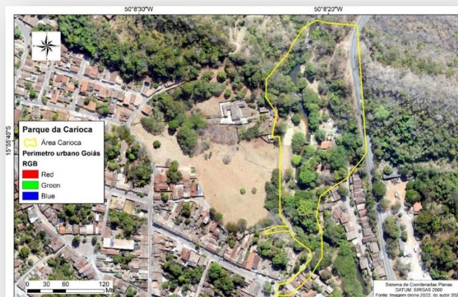
Figura 01: Área do Parque da Carioca no município de Goiás, 2022.

A formação do Parque da Carioca na cidade de Goiás remonta a época da colonização. A fonte foi construída em 1772, entre o Rio Vermelho e a Estrada Real, onde passou a ser ponto de encontro dos moradores, viajantes e tropeiros que chegavam pela Estrada do Nascente. A Carioca faz parte de um conjunto de monumentos preservados daquela época, para o Instituto do Patrimônio Histórico e Artístico Nacional (IPHAN, 2012), a relevância desses monumentos faz da área da Carioca um museu histórico e arqueológico a céu aberto (Figura 01). O conjunto desses bens culturais, o patrimônio natural que os envolve e a convivência permanente da comunidade neste lugar, transformam-no naturalmente em um Ecomuseu, (IPHAN, 2012).