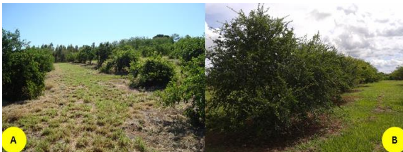
Figura 1: Pomar experimental da APTA em Adamantina (SP) com as aceroleiras. Autoria: Maurício Dominguez Nasser (A - 2014; B - 2018).

Segundo Herrera et al. (1997), o clima da região é classificado como Cwa, subtropical úmido segundo a classificação de Köppen (1948); sendo o verão quente e chuvoso e inverno seco e ameno (HERRERA et al. , 1997). A média de temperatura é próxima de 24 °C, e a precipitação de 1.283 mm (CIIAGRO, 2013).