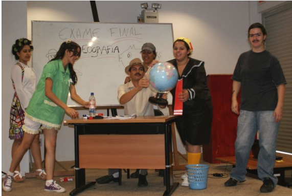
Foto1 – Bolsistas em ação