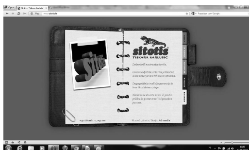
Figura 2 – Website Sitotis – www.sitotis.hr

O Sitotis possui um website visualmente bem elaborado, com um design impecável, onde observamos um modelo de uma agenda, com fundo cinza realçando as cores da agenda, a distribuição dos menus é feita no canto direito como em marcadores de uma agenda. Sua imagem é ilustrada na figura 2.