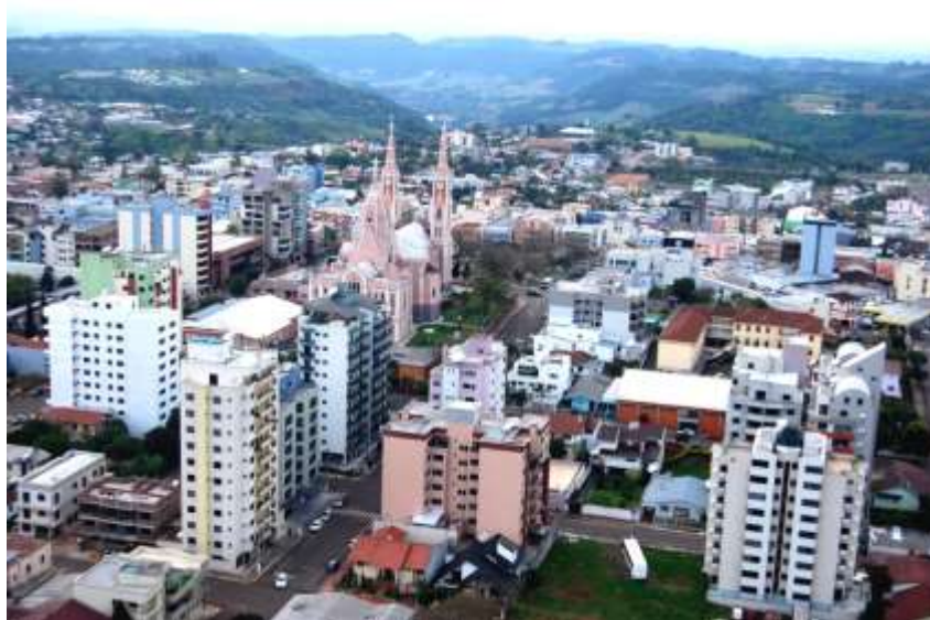
Figura 1: Foto panorâmica de Frederico Westphalen. AUTOR: FREDERICO WESTPHALEN, 2016

Castelo, sendo acordado por todos os presentes que o nome deveria homenagear ao primeiro Chefe do Escritório da Comissão de Terras: Frederico Westphalen. [...] Em 1º de setembro de 1953, foi aprovada a Lei 2.116 que tratava da criação de vinte novos municípios no Estado do Rio Grande do Sul, entre eles: Frederico Westphalen. [...] Em plebiscito realizado com a comunidade, prevaleceu o “sim” e em 15 de dezembro de 1954, o Governador Ernesto Dornelles assinou a Lei 2.523 aprovando a criação do 98º município do Estado: Frederico Westphalen. [...] A economia industrial se dá pelas indústrias expressivas nas áreas metalúrgica, fibra de vidro, lapidação de pedras semipreciosas, fábrica de colchões e ração animal. Ainda, possui abatedouros de suínos, bovinos e aves, além do potencial na área agrícola, caracterizando-se pela pequena propriedade rural, as agroindústrias familiares, na avicultura, piscicultura e a agroindústria de pequeno porte. O Município destaca-se no setor educacional, contando atualmente com duas instituições de Ensino Médio e Tecnológico e quatro instituições de Ensino de Nível Superior (FREDERICO WESTPHALEN, 2016, p. 01).