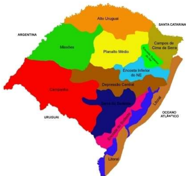
Figura 2: Região do Médio Alto Uruguai do RS. AUTOR: UFSM (IFCRS).

Neste estudo, procuro “a partir da totalidade sintética, que é o discurso específico de um indivíduo – reconstruir uma experiência humana vivida em grupo e de tendência universal” (MARRE, 1991, p. 89). Tal discurso individuado 2 erige-se na imagem, ou na figura histórica e social de um padre-historiador, ou de um historiador-padre chamado Monsenhor Vitor Battistella, que foi considerado como um referencial polivalente de poder religioso-ideológico, de poder social-ideológico e de poder cultural-ideológico durante pouco mais da primeira metade do século XX na região do Médio Alto Uruguai, Rio Grande do Sul. “A maioria o via como um “pai”, um “santo”, um homem de capacidades ímpares, um “herói”, desbravador, batalhador, clarividente”, destaca Sponchiado (2005, p. 03). Ainda sobre ele, destaque: