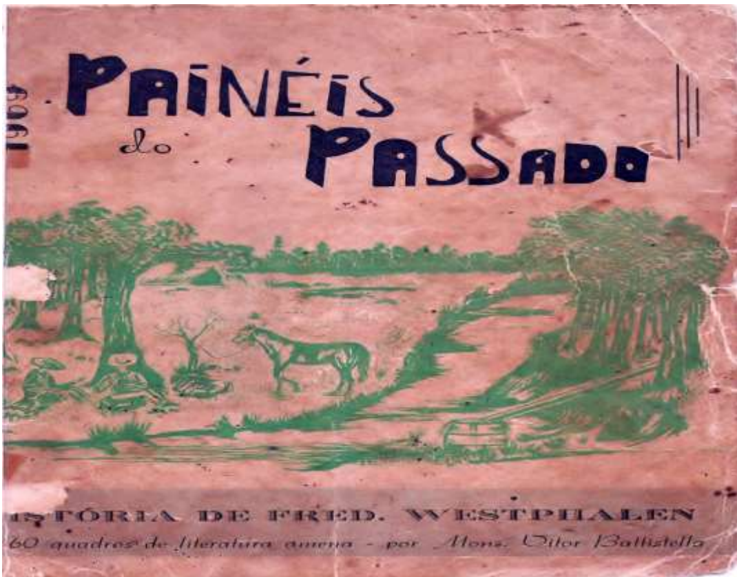
Figura 04: Capa do livro Painéis do passado, a história de Frederico Westphalen em sessenta quadros de literatura amena .