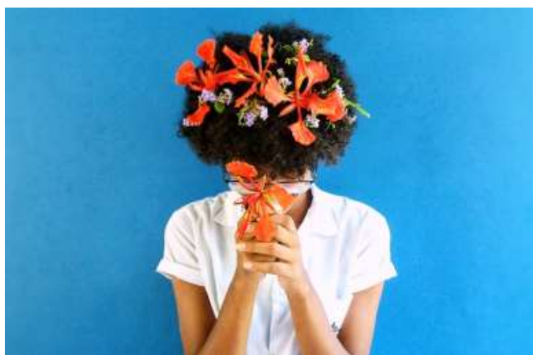
Figura 2: fotografia de uma aluna no processo de criação dos corpos mais artes visuais/2017.

Os critérios de composição fotográfica foram surgindo a partir de cada proposta e questionamento vindo das pesquisas, como: “essa árvore não era para aparecer”; “está muito escuro”; “a luz estourou”; “à luz natural do dia”; “ficou muito longe”; “deu ideia que eu estou segurando o sol”; “isso chamou muita atenção”; “foto só preto e branca” (como se as neutras não fossem cores); etc. Embora tenham sido critérios chamados por mim dessa forma, só depois comecei a estudar sobre eles e perceber que era bastante interessante esse caminho em uma formação de professores/as, pois estava sendo trabalhado um aprimoramento das qualidades estéticas, conforme a figura 2. Essas qualidades partiram de um olhar intuitivo para um olhar mais cuidadoso sobre as fotografias, assim como o uso da presença do corpo artístico/poético nessa relação entre a câmera e o espaço.