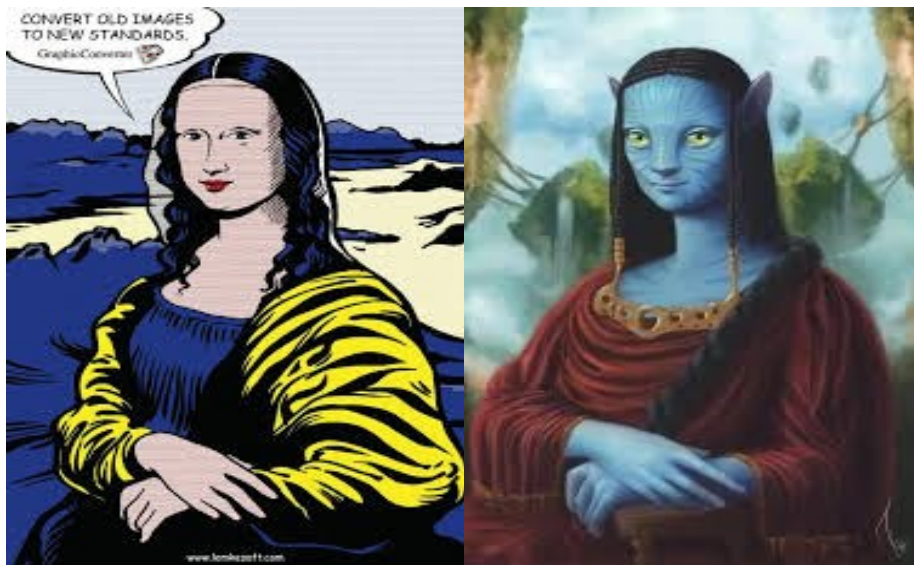
Fig. 3 – Mona Lisa por art // Fig. 4 – Mona Lisa avatar