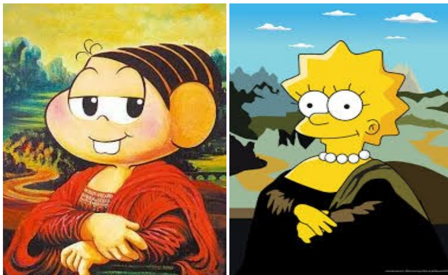
Fig. 5 – Mona Lisa / Mônica // Fig. 6 – Mona Lisa / Lisa Simpson

Em todas as reproduções acima, podemos perceber que as figuras retratadas mantêm certas características da personagem concebida por Leonardo da Vinci, as quais facilitam ao espectador reconhecer que entre todas elas existe um elo de ligação, um diálogo entre essas representações pictóricas.