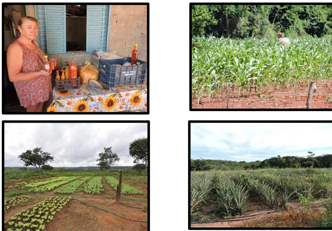
Figura 2 – Produção agrícola e produtos a serem vendidos na feira