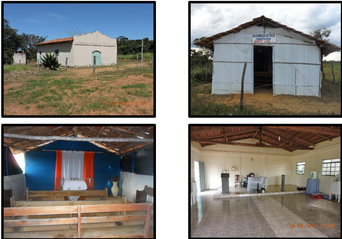
Figura 4 – As igrejas católica e evangélica nos assentamentos