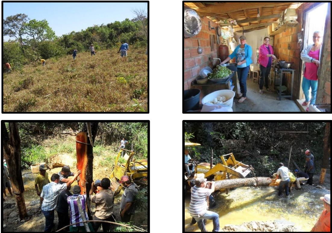
Figura 5 - Mutirão para limpeza de pasto, preparo do almoço e construção de ponte