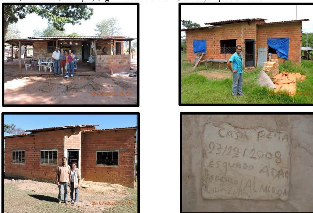
Figura 3 – Residências nos assentamentos