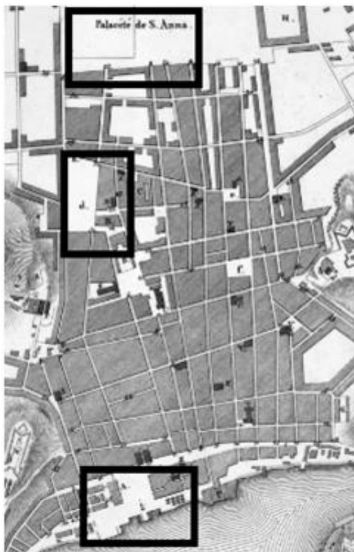
Figura 4 - Territorialização da concentração de bailes.

novembro, o Teatro São Januário chamado também de Teatro Provisório próximo a sede do Paço Imperial, conforme assinalado na figura 5.