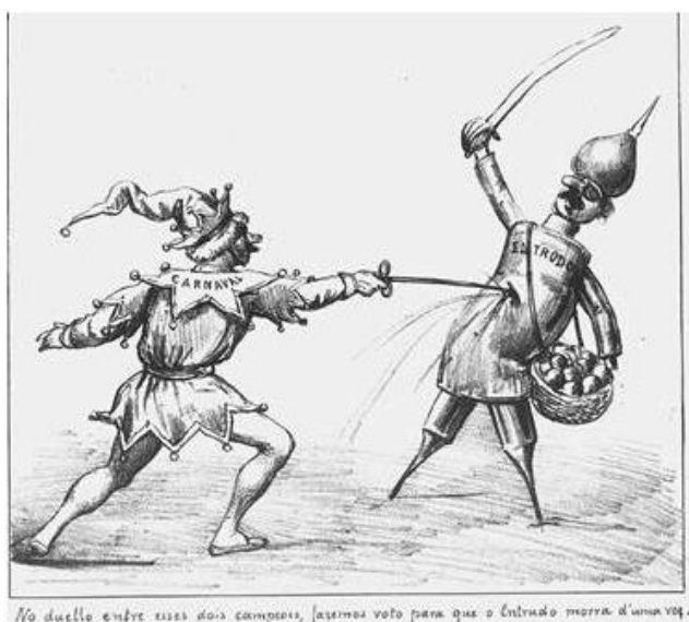
Figura 7 - Duelo entre Entrudo e Carnaval.

No decorrer dos anos após os primeiros bailes quando estes deixaram de ser novidade e passaram a serem incorporados no cotidiano carnavalesco da cidade, os transeuntes com destino aos teatros se tornaram alvos das molhadelas e da confusão que acontecia nas ruas desde o arremesso de limões de cheiros a banhos de água suja. Tal fato pode se atribuir a uma herança cultural do entrudo, que se apresentou fortemente como forma de se brincar o carnaval. Pode-se também entender como uma resistência a forte campanha de degradação dessa prática que foi diretamente vinculada a uma postura que remonta a “selvageria” e violência. A manifestação popular passa a ser considerada como um “não carnaval”, já que a partir deste momento o verdadeiro carnaval, era aquele que era celebrado através das fantasias e máscaras luxuosas nos bailes públicos e privados, conforme ilustra a figura 8. Tendo as reuniões privadas tendo a primazia de ser fiel aos costumes franceses e não se deixar influenciar pelas adaptações da cultura ao entrar em contato com certo grupo social que justifica organizações espaciais específicas (CLAVAL, 2007).