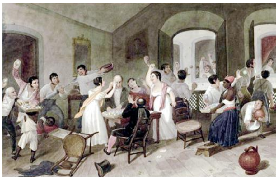
Figura 2 - Representação dos festejos do entrudo familiar. Fonte: AUGUSTUS, Earl. 1822 2

Em relação à segregação social, é abordado que os alvos preferidos para os projéteis eram os escravos negros que serviam a casa e os estrangeiros que não entendiam o porquê de terem sido alvos de constantes ataques sendo que o negro que se rebelasse perante o seu senhor, era duramente castigado segundo Ferreira (2004). Acima de tudo, sua principal função como festejo era a reafirmação dos laços de parentesco e de interesses comerciais (FERREIRA, 2005). Esses arranjos e rearranjos familiares segundo DaMatta (1997) são sistemas ao reduzir as interações entre traços genéticos e de propriedade, e também representação da posição social dos grupos e segmentos do mundo cotidiano (DAMATTA, 1997). Além da reafirmação das relações sociais, há a produção do território como resultada dos festejos carnavalescos no que se refere à condição social e assim, o desenvolvimento de uma identidade com os festejos resultante desse processo (SAQUET, 2015).