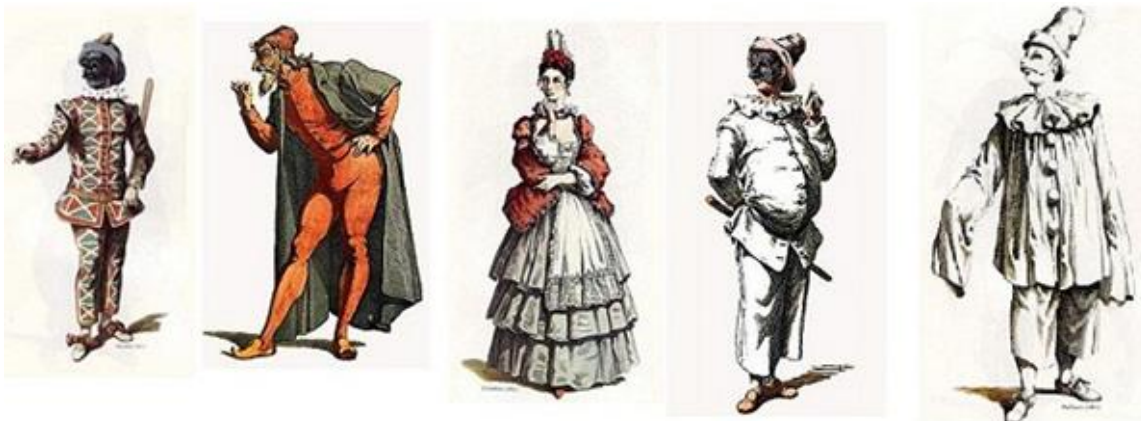
Figura 5 - Trajes famosos da Commedia dell'Arte 5 6

Bailes mascarados. Na Rua do Carmo, número 146, há grande sortimento de vestuários de fantasia que serão alugados aos amadores d'estes divertimentos por commodos preços. (Diário do Rio de Janeiro, 21 de Fevereiro de 1852).