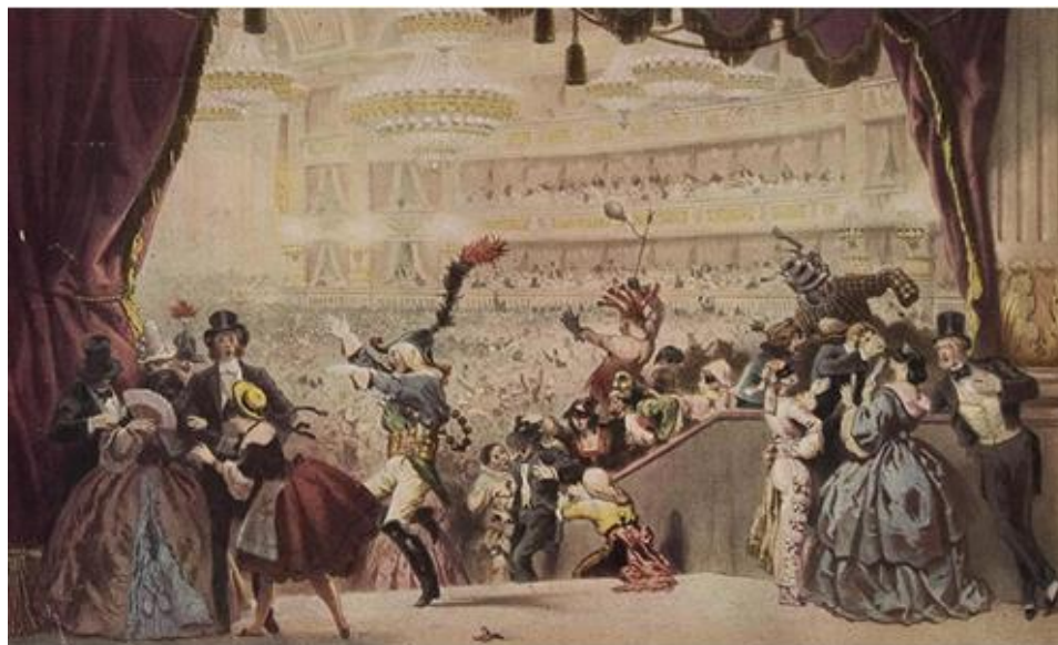
Figura 6 - Representação de um baile carnavalesco. Fonte: GUERAVE, 1883 7

dos ritmos galope infernal e cançã, que se tornaram marcas dos bailes no lugar das encenações de peças e óperas que permeavam grande parte das apresentações dos grupos distintos durante os bailes (FERREIRA, 2004).