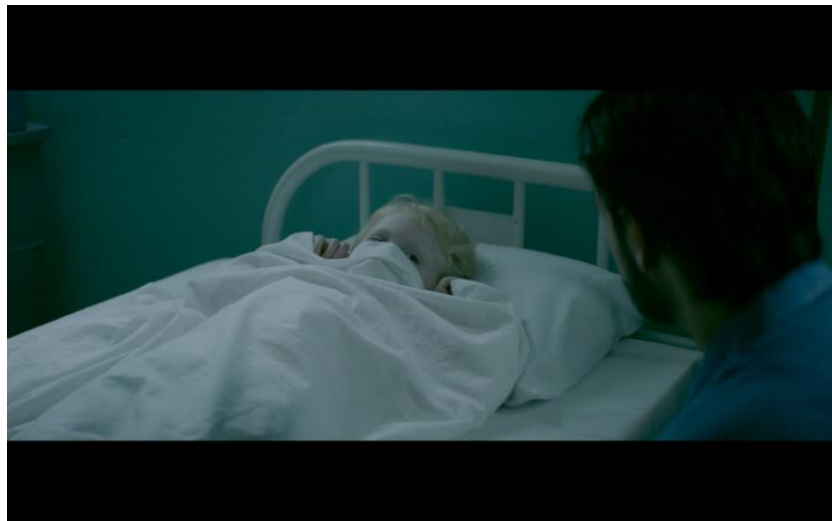
Figura 2 - Screenshot. Paciente teme a presença de Malin em seu quarto